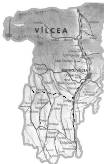
Locație Chimcomplex S.A. Borzești - Sucursala Rm. Vâlcea