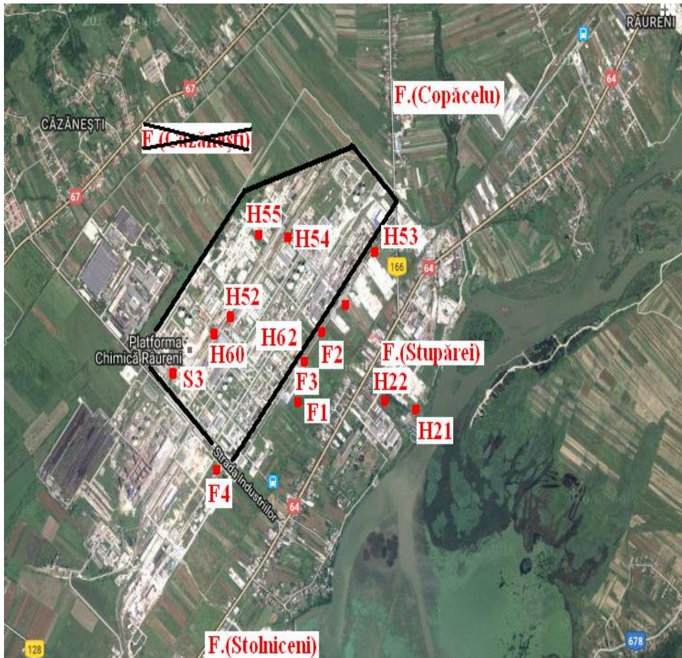
b) Amplasarea si starea fizica a forajelor în perimetrul batalului de reziduuri organice